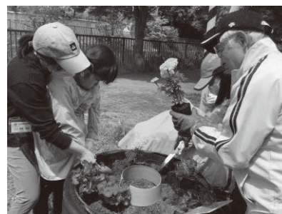
プランターへの移植 (フラワースマイル作戦)