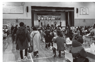
ステージ発表の様子

また、生徒が地域住民と共にイベントを築き上げる経験を通して、生徒一人ひとりの知的好奇心や、よりよく生きたいという向上心を高め、学校外でも学び続ける意義や楽しさを経験する機会にもなっている。