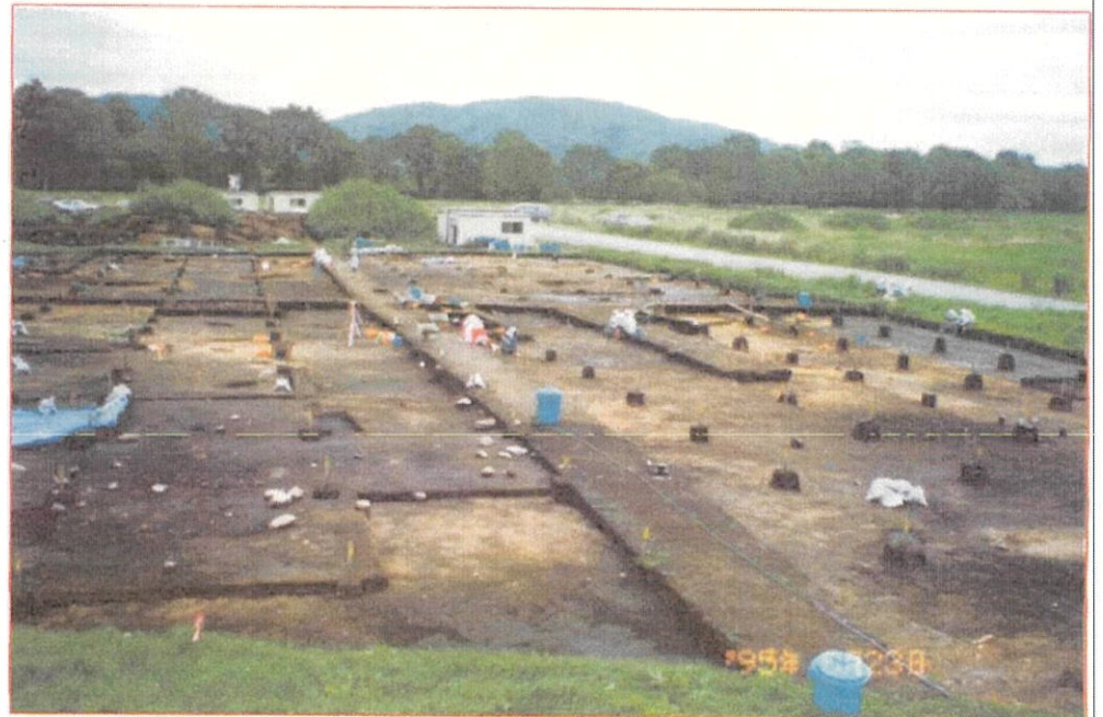
西舎3遺跡 平成7年('95)調査②

そして、遺跡がたくさん見つ かっている場所、西舎遺跡は、 主にアエル、J R Aが西舎遺跡に はいています。ここで見つか った土器は右の図のように掘っ て見つかっています。土器以外 にも竪穴住居、Tピットなどが あった跡も見つかっています。