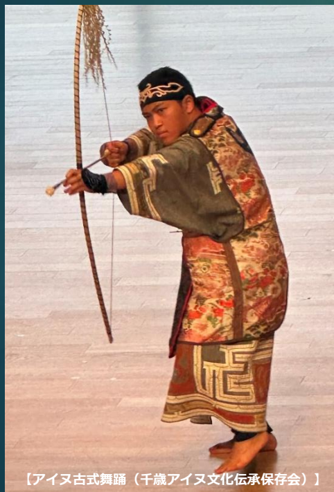
【アイヌ古式舞踊（千歳アイヌ文化伝承保存会）】