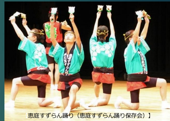
恵庭すずらん踊り（恵庭すずらん踊り保存会）】