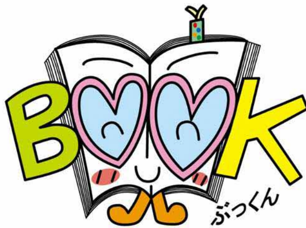
北海道「朝読・家読運動」イメージキャラクター