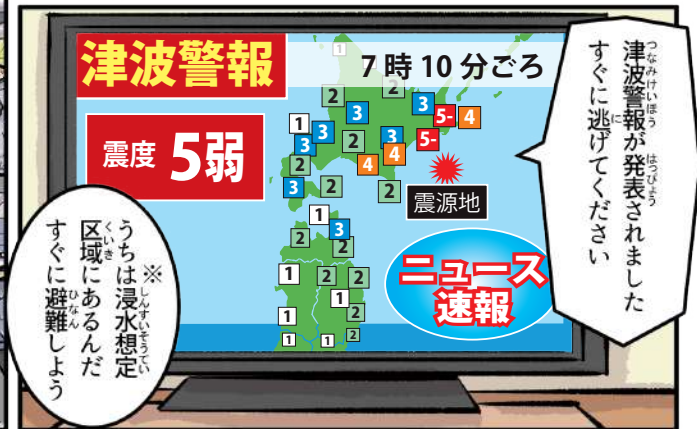
※津波によって水につかるおそれのある場所