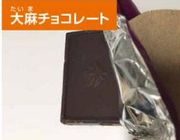
大麻チョコレート

自分を守るために、大麻類似成分を含む製品を安易に購入したり、食べたりすることのないよう注意してください。