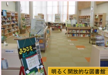
明るく開放的な図書館