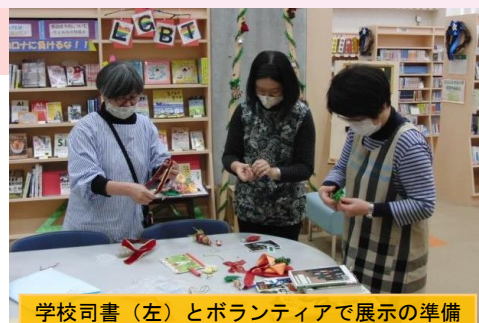
学校司書（左）とボランティアで展示の準備

巴中学校では、学校司書、司書教諭、教員、図書委員に加えて、地域の図書館ボランティア約10人が学校図書館の運営に関わっています。学校司書の勤務終了後は、ボランティアが貸出・返却や生徒の利用を見守ることで、午後4時45分の閉館時刻まで多くの生徒が学校図書館を利用することにつながっています。