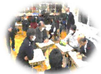
【学校運営協議会における ワークショップの様子】

参考：令和4年度「コミュニティ・スクールと地域学校協働活動の一体的推進」に係る文部科学大臣表彰