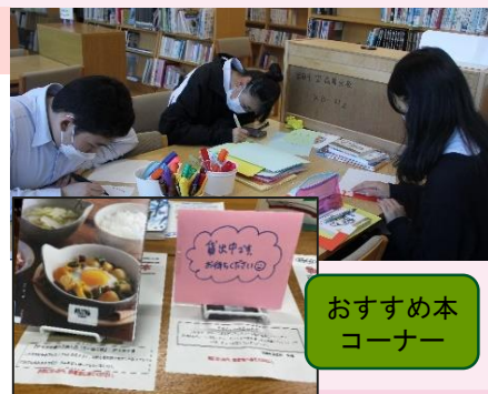
おすすめ本コーナー

図書委員が中心となり、蔵書を紹介するポスターやPOPを作成し、学校図書館内や生徒玄関ホールの図書紹介コーナーに掲示し、校内における親しみやすい読書環境を構築しています。図書展示台の一部は、電気・建築科の生徒が跳び箱を再利用して制作しました。学校図書館の静かな雰囲気や、学校司書との関わりを楽しみにやってくる生徒もいるなど、居心地の良い図書館づくりが進められています。