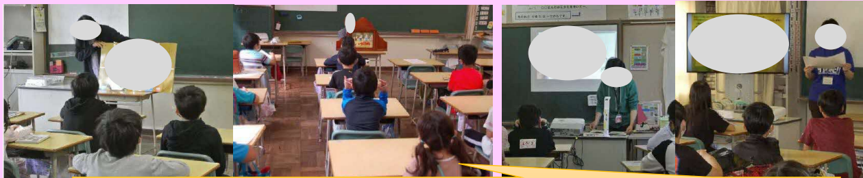
大型絵本、紙芝居、実物投影機などを活用しながら読み聞かせを実施、児童も熱心に聞き入っています。

読み聞かせをはじめ、「読書貯金通帳」の取り組みなど、様々な読書活動の工夫により、不読率が改善してきています。