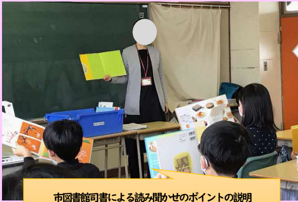
市図書館司書による読み聞かせのポイントの説明

司書からの助言を基に、読み聞かせる絵本の選定や読み聞かせの練習をするなど、熱心に取り組む様子が見られました。また、読み聞かせ当日は、読み聞かせを聞いてくれた1年生との交流を通して、さらに読書の楽しさを実感していました。