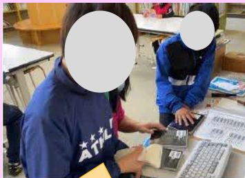
児童でも簡単に貸出ができる