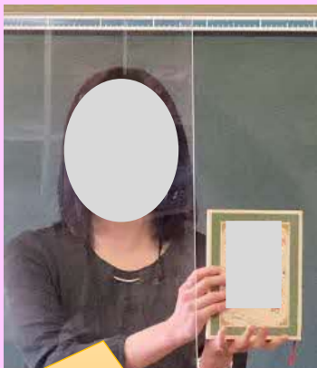
町図書室司書による本の紹介の例示

図書貸出業務や図書の検索等の業務が円滑になり、学校図書館が活用しやすくなりました。