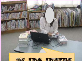
学校、町教委、町図書室司書が協力して、蔵書データを入力