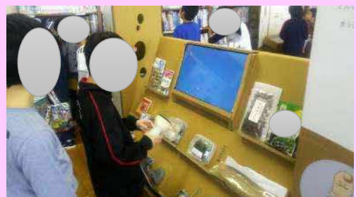
市立図書館の展示借受