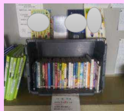
市立図書館からの団体貸出