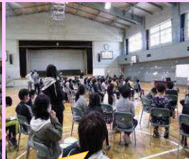
紹介後のディスカッション