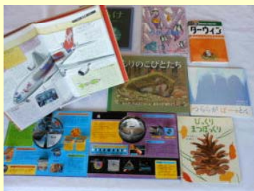
【理科読おすすめ本】