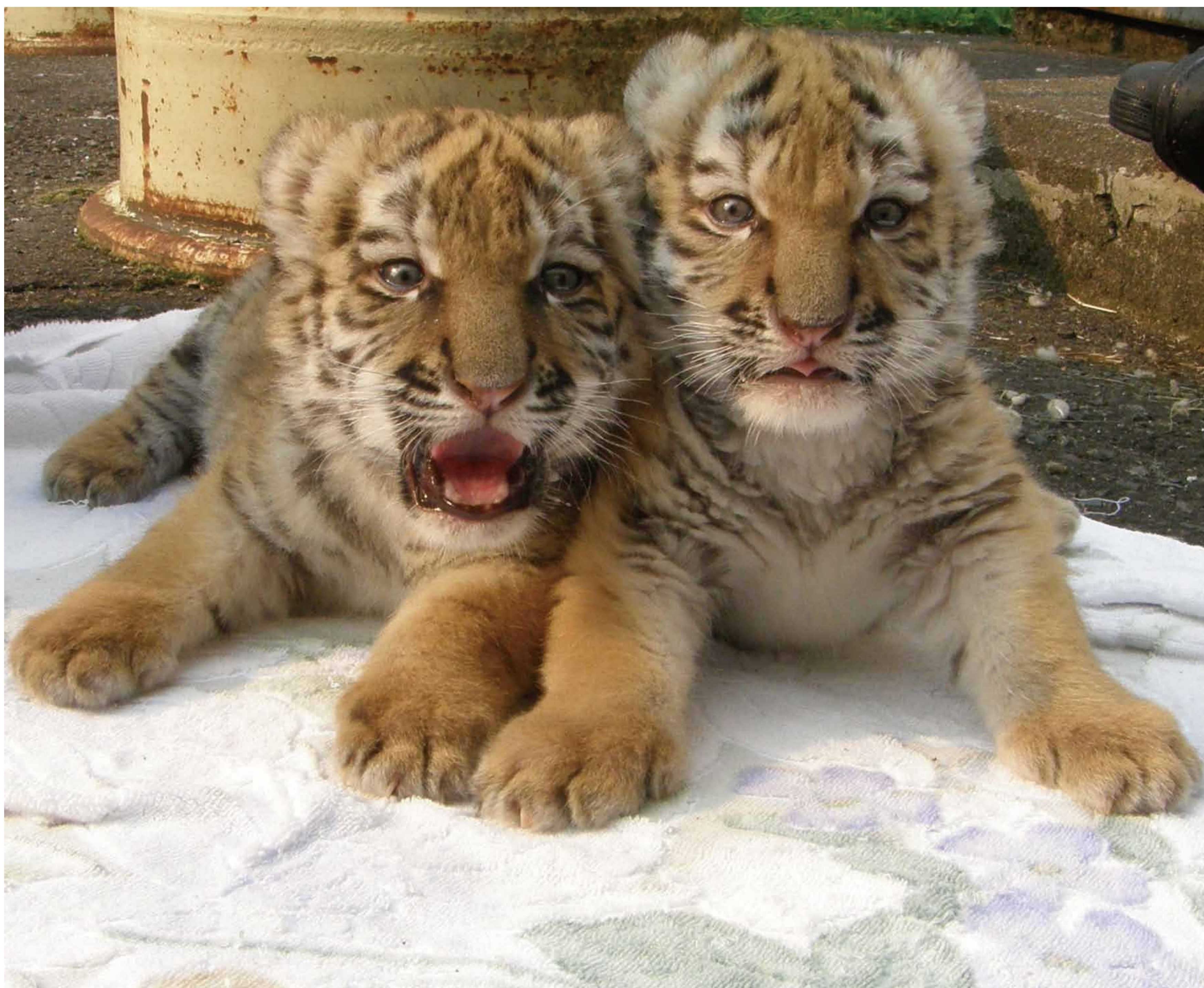
ていきょう くしろ し どうぶつえん 提供 釧路市動物園 ひだり みぎ (左がタイガ、右がココア)

せいめい し じ た せいめい そんちよう [生命がかけがえのないものであることを知り、自他の生命を尊重する。]