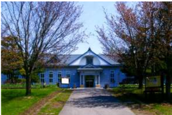
博物館網走監獄庁舎