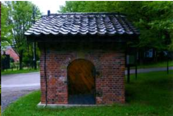
博物館網走監獄煉瓦造り独居房