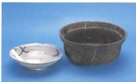
絵唐津大皿・内耳鉄鍋