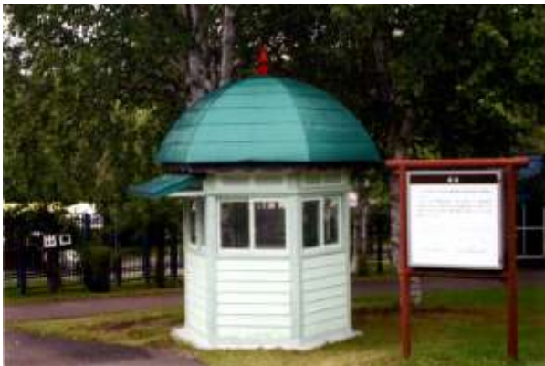
博物館網走監獄鏡橋入口哨舎