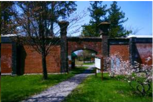
博物館網走監獄裏門

北海道教育委員会では、道内の文化財についての情報を、次のホームページで公開しています。また、文化庁では全国の文化財のデータベースを公開しており、全国の文化財情報を検索することができます。道内の文化財の情報も多数掲載されていますので、皆さんの身近にある文化財を見つけましょう。