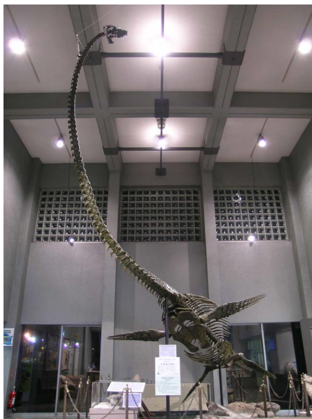
むかわ町穂別博物館に展示されている 復元されたホベツアラキリュウ化石

◆どうして海にすんでいた生物の化石がむかわ町穂別の山中でみつけるの？ ホベツアラキリュウが生きていた8,300万～8,100万年前の北海道の真ん中は暖かい海でした。その後、数百万年前から土地が高くなりはじめ、現在のような陸地となりました。