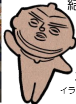
カックー イラスト：なっき45