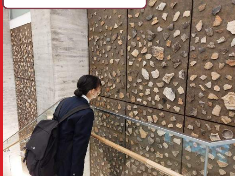
山内丸山遺跡 館内見学