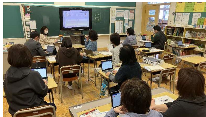
【ICT活用校内ミニ研修の様子】