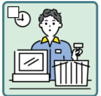
家計を支えるために労働をして、障がいや病気のある家族を助けている