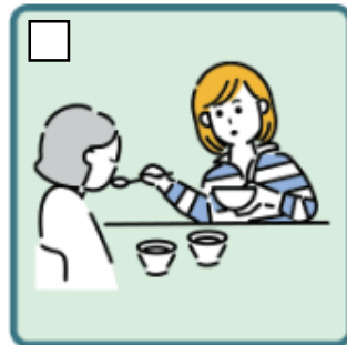
障がいや病気のある家族の身の回りの世話をしている