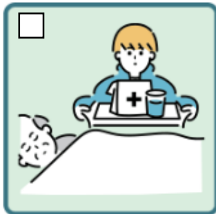
がん・難病・精神疾患など慢性的な病気の家族の看病をしている