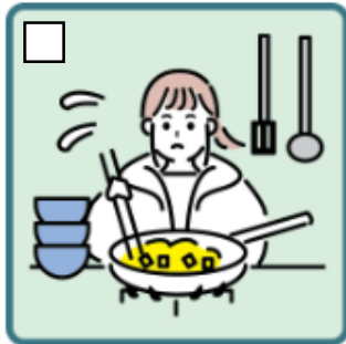
障がいや病気のある家族に代わり、買い物・料理・掃除・洗濯などの家事をしている