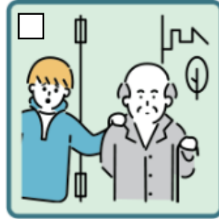
目を離せない家族の見守りや声かけなどの気づかいをしている