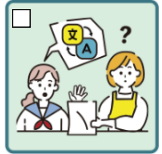
日本語が第一言語ではない家族や障がいのある家族のために通訳をしている