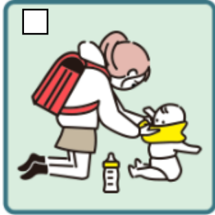
家族に代わり、幼いきょうだいの世話をしている