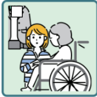
障がいや病気のあるきょうだいの世話や見守りをしている