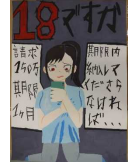
【優秀賞】 北海道中標津高等養護学校 1年 志和地 穂香