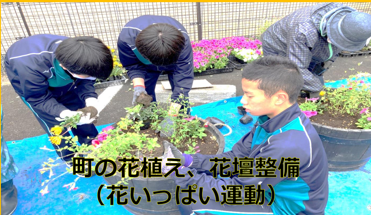
町の花植え、花壇整備 (花いっぱい運動)