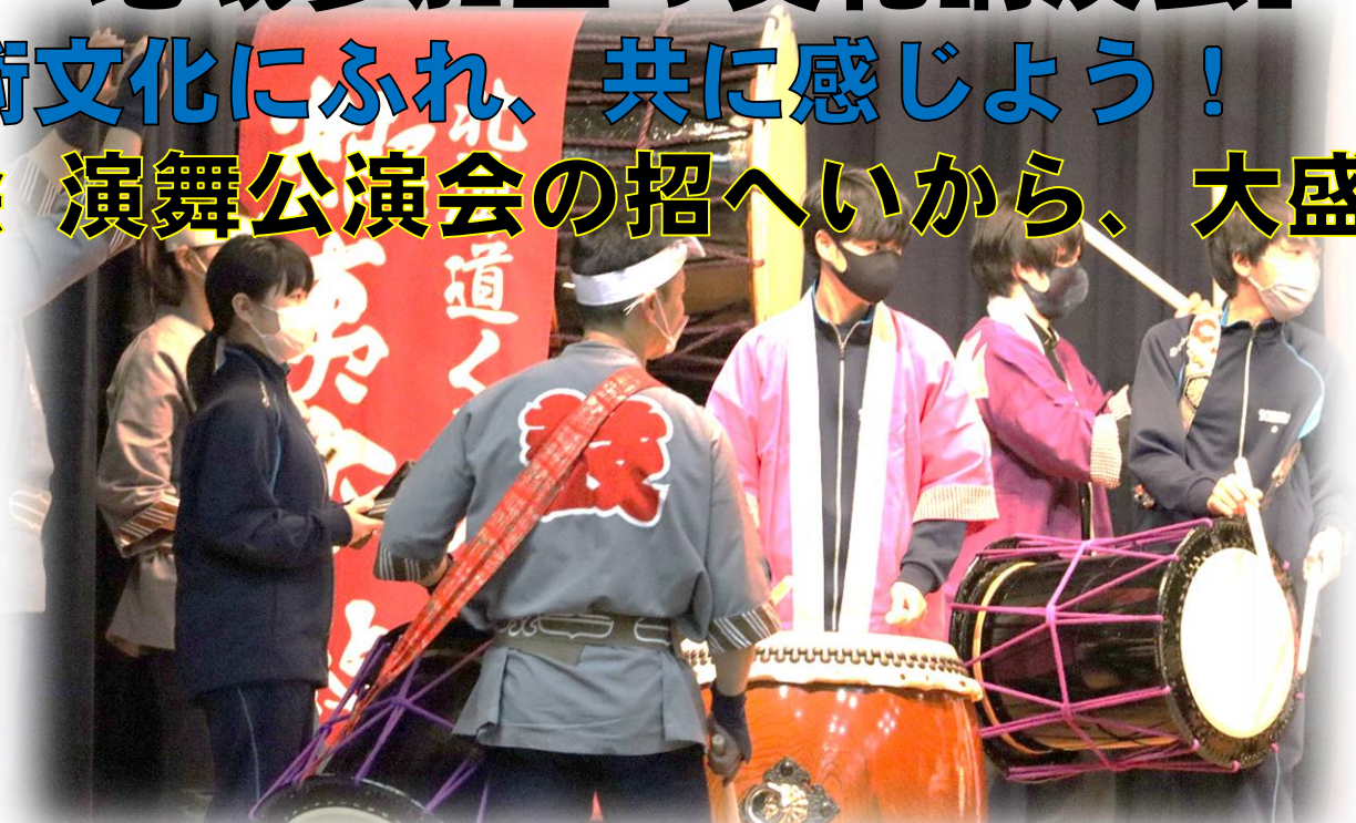
和太鼓体験、保存会の皆さんとセッション