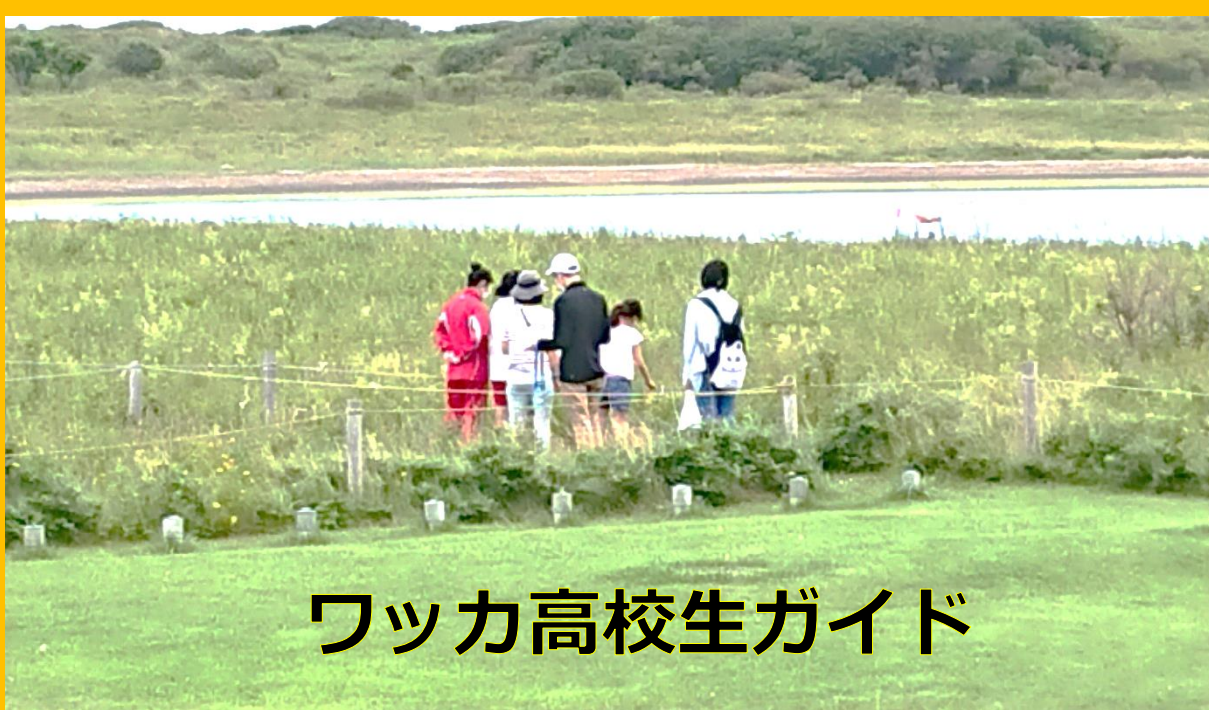
ワッカ高校生ガイド