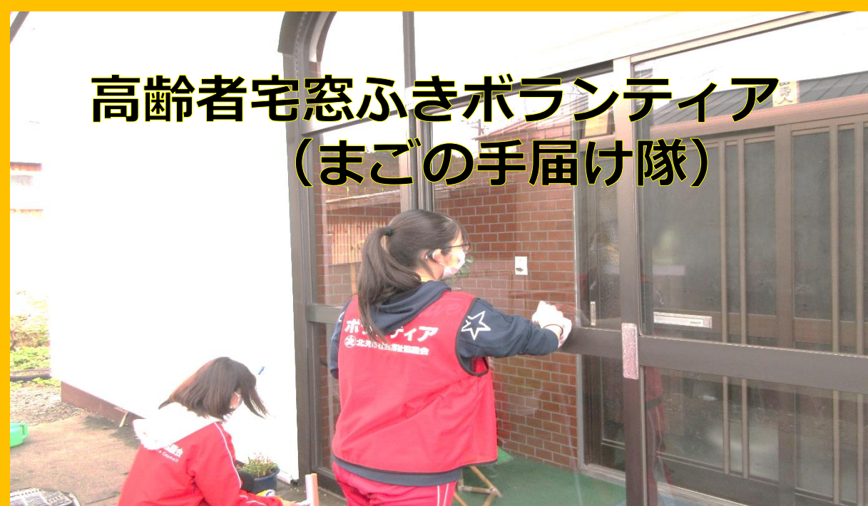
高齢者宅窓ふきボランティア (まごの手届け隊)