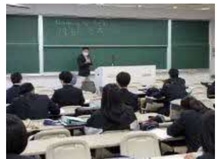
▲ 上級学校訪問・職場見学