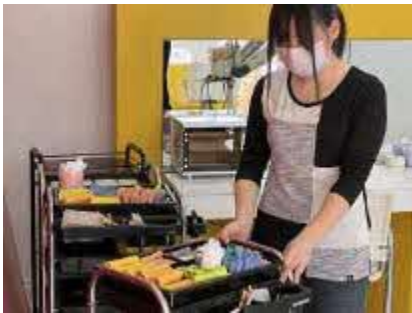
▲ インターンシップ

浦河高校は、自ら課題を発見し、目標達成に向け他者と協働しながら、北海道や地域を支える共生社会実現に資する人材の育成を目指しています。あなたが生涯にわたり、よりよいキャリアを重ねるために「産業社会と人間」「総合的な探究の時間」での学習や様々な行事を含めた、すべての教育活動を通してキャリア形成をサポートします。