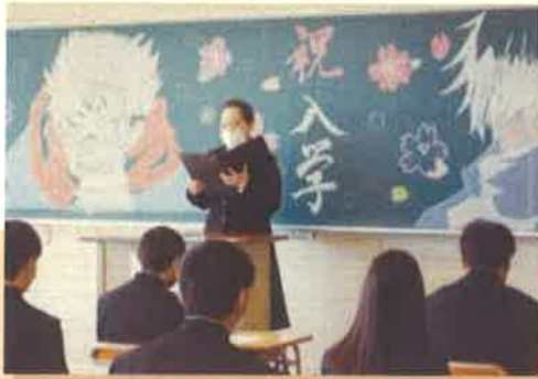
入学式・始業式・対面式