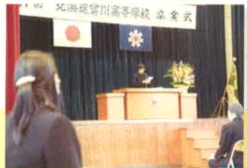
学年末考査・学習成果発表会・ 卒業証書授与式・修了式