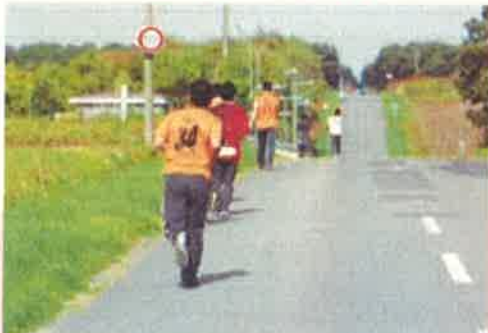
体育大会・インターンシップ・マラソン大会・ 前期末考査・前期終業式