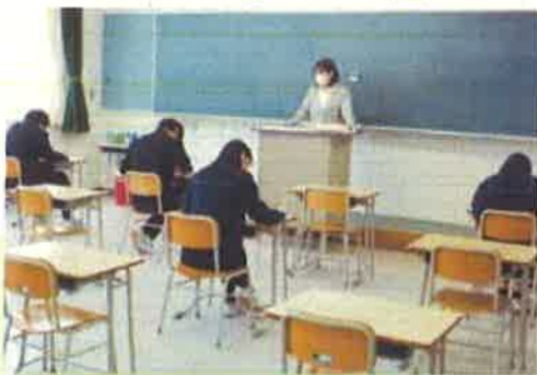
宿泊研修・卒業考査