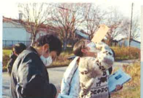
後期始業式・大学訪問・見学旅行・進路講話