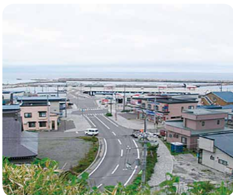
復興した奥尻町の街並み (「はあとふる・2」より)

当時の町長は、山野に実る山ブドウに注目し、ワインづくりという夢のある事業を思いつきブドウ栽培を町民に呼びかけました。大冷害のためブドウ樹が枯れ果てるなどの事態に見舞われながらも、町では辛抱強く厳寒でも育つブドウの調査・研究を続けました。その後、ワインづくりに適したブドウの品種の開発に成功し、今や池田町は「ワインの町」となりました。