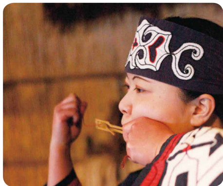
アイヌの人たちの伝統的な楽器 「ムックリ」