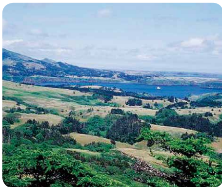
北方領土の色丹島の自然 (「はあとふる」より)