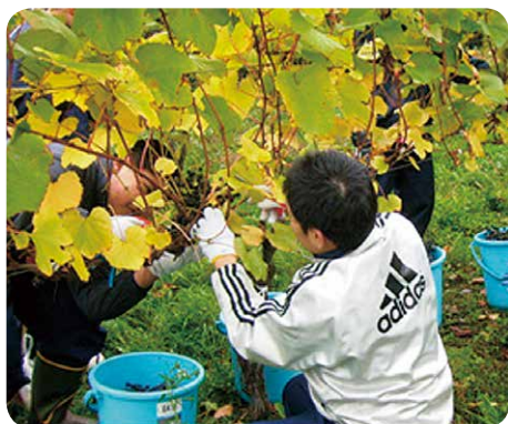
池田町のブドウの収穫 (「はあとふる・2」より)