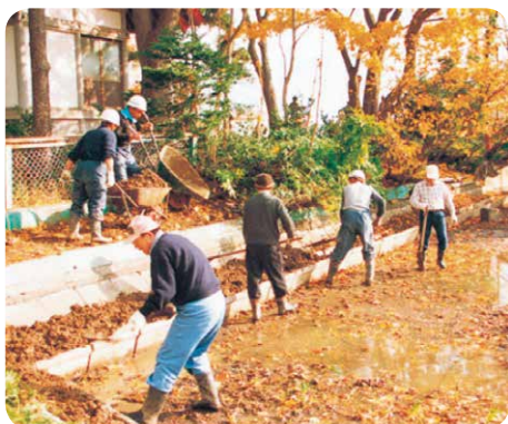
ホテルのすみかをつくる沼田町の皆さん (「はあとふる・2」より)