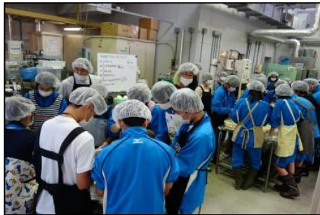
さけフレーク加工実習