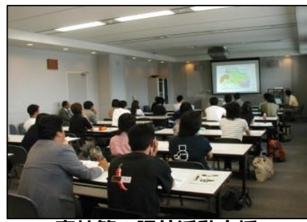
高校等の課外活動支援