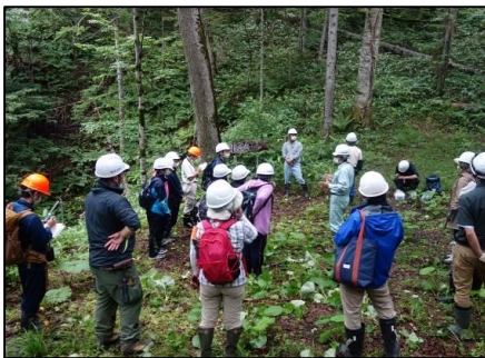
水源地の共同調査