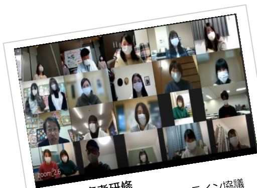
初任保育者研修 Zoom を活用したオンライン協議

・幼児教育相談員派遣事業について、従来の「派遣型」に加え、「 リモート型 」での助言を実施