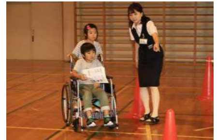
車椅子の人を想定し、避難誘導しています。