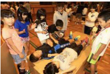
段ボールベッドに寝ています。