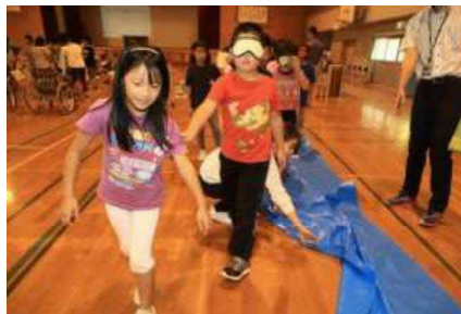
目が見えない人を想定し、避難誘導しています。