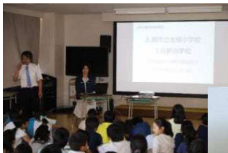
災害時の活動等を説明しています。