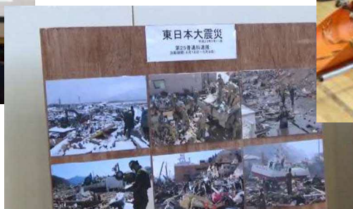
災害活動時の写真を展示しています。