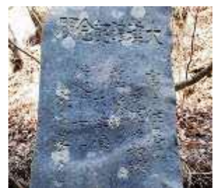
大津波記念碑(宮古市)

古くから津波に襲われてきた三陸地方には、「津波てんでんこ」という言い伝えがあります。この言い伝えには、「津波が来たら、各自てんでんばらばらに高台へ逃げて自分の命を守る」という意味があります。また、津波の被害を受けた場所を伝えるため「此処より下に家を建てるな」という祖先の教えが刻まれた石碑も数多く残されています。こうした祖先からの言い伝えが今も語り継がれています。