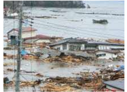
「平成23年(2011年)東北地方太平洋沖地震」後の津波で流される家

津波の特徴を理解し、津波のおそれがある場合には、あわてず速やかに行動できるように備えましょう。