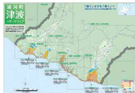
「津波ハザードマップ」 (提供：浦河町)

市町村などの自治体が、洪水や津波などの災害が発生した時に、住民が安全に避難できるよう、被害の予想区域や程度、避難場所などを示した地図のこと。