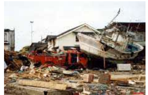
被災直後の奥尻町

平成5年(1993年)7月に発生した「平成5年(1993年)北海道南西沖地震」では、地震発生直後に奥尻島をはじめ北海道や東北地方の日本海沿岸などに津波が押し寄せました。地域によっては津波の遡上高が30メートル以上になるところもあり、震源に近い奥尻島を中心に地震や津波、火災などにより死者202人、行方不明者28人の被害が生じました。