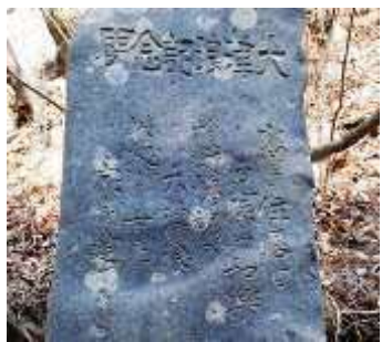
おおくつなみきねん 大津波記念碑(宮古市)

とうほくちほう ふる つなみ つなみ き 東北地方には古くから「津波てんでんこ」という「津波が来たら、 それぞれが、てんでんばらばらに高いところへ逃げて自分の命を まも 守る」という言い伝えがあります。また、津波の被害を受けた場所 つた せきひ おお のこ を伝える石碑も多く残されています。