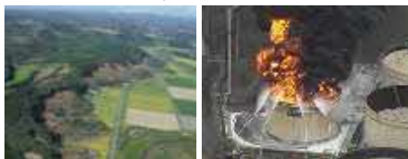
さんぶくほうかい ちよまちよう 山腹崩壊(厚真町)