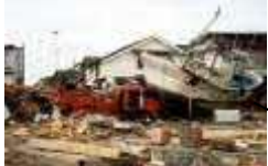
ひさいちよくこ おくしりちよう 被災直後の奥尻町