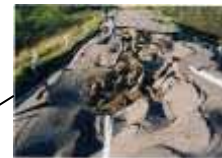
どうろ ひがい (別海町) 道路の被害(別海町)