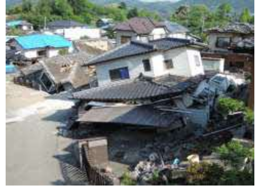
へいせい ねん (2016年) ねん くもとじしん たいもの ひがい 平成28年(2016年)熊本地震による建物の被害

にほん せかい 日本は世界のなかでも地震の多い国なんだって。 じしん たてもの 地震で建物がこわれたり、 じしん つなみ かじ 地震のあとに津波や火事がおきたりして、 ひがい ひと 被害にあった人もたくさんいるみたいだよ。