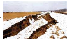
くしろがわりゆういき ていぼう ひがい 釧路川流域の堤防の被害