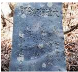
大津波記念碑 (宮古市)

古くから津波に襲われてきた三陸地方には、「津波てんでんこ」という言い伝えがあります。この言い伝えには、「津波が来たら、各自てんでんばらばらに高台へ逃げて自分の命を守る」という意味があります。また、津波の被害を受けた場所を伝えるため「此処より下に家を建てるな」という祖先の教えが刻まれた石碑も数多く残されています。こうした祖先からの言い伝えが今も語り継がれています。