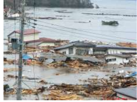
「平成 23 年(2011 年)東北地方太平洋沖地震」後の津波で流される家

津波の特徴を知り、日常的に避難場所や避難経路を確認しておくなど、いざというときに適切な行動を取るための備えをしておきましょう。