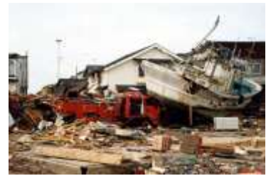
被災直後の奥尻町

平成 5(1993)年 7 月に発生した「平成 5 年(1993 年)北海道南西沖地震」では、地震発生直後に奥尻島をはじめ北海道や東北地方の日本海沿岸などに津波が押し寄せました。地域によっては津波の遡上高が 30 メートル以上になるところもあり、震源に近い奥尻島を中心に地震や津波、火災などにより死者 202 人、行方不明者 28 人の被害が生じました。