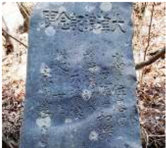
おおくつなみきねん び 大津波記念碑(宮古市)

とうほくちほう ふる つなみ つなみ き 東北地方には古くから「津波てんでんこ」という「津波が来たら、 それぞれが、てんでんばらばらに高いところへ逃げて自分の命を まも 守る」という言い伝えがあります。また、津波の被害を受けた場所 をつた せきひ おお のこ を伝える石碑も多く残されています。