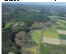
山腹崩壊(厚真町)