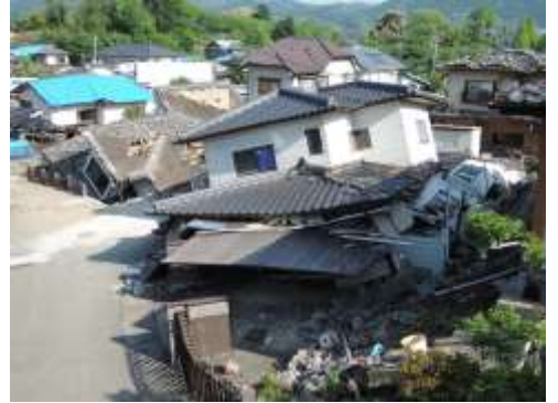
へいせい 28 ねん (2016 年) 熊本地震による建物の被害

にほん せかい 日本は世界のなかでも地震の多い国なんだって。 じしん 地震でたてものがこわれたり、 じしん 地震のあとに津波や火事がおきて ひがい 被害にあった人もたくさんいるみたいだよ。