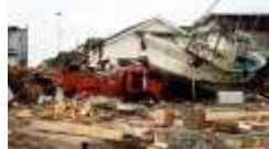
被災直後の奥尻町