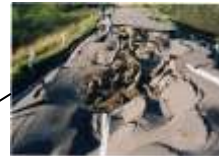
道路の被害(別海町)