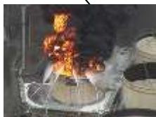
石油タンクの火災(苫小牧市)