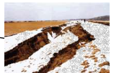
釧路川流域の堤防の被害