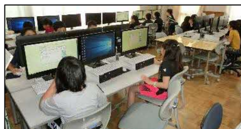
【朝学習を通じた日常的な活用】