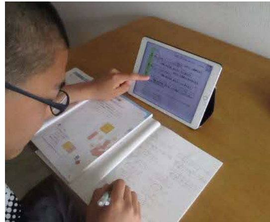
【タブレット端末を活用した家庭学習の様子】