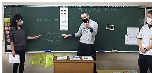
【学校が作成・発信した動画教材】