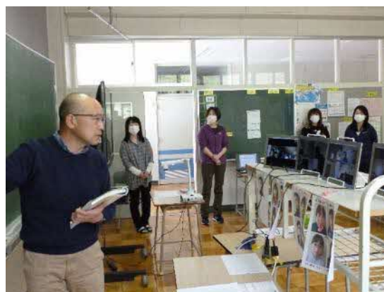
【オンライン授業の様子】