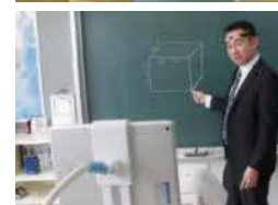
【オンライン授業の様子】