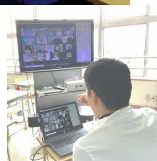
【オンライン朝の会の様子】