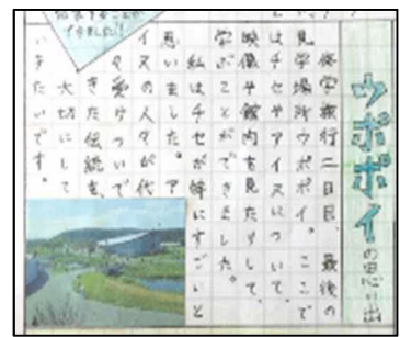
【新聞形式のまとめ】