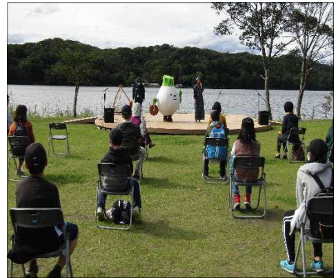
【アイヌの人たちの文化の鑑賞】