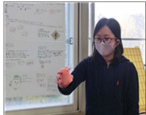
【児童の発表時の様子】