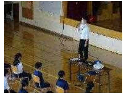
【だて歴史文化ミュージアム学芸員講演会】

生徒は、「だて歴史文化ミュージアム」の学芸員による講演を受講したことにより、アイヌの人たちの歴史や文化に対する興味・関心が高まり、「日々の生活と比較・関連付けすることで、アイヌ民族や文化について理解を深めよう」という学習課題を設定しました。