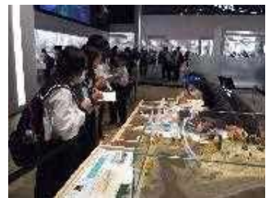
【「ウポポイ」施設見学】

インターネット等を活用して、「歴史」、「歌・舞踊」、「衣服」、「住居」、「食事」、「伝統儀式」の6つのテーマで調べ学習を行いました。その後、「ウポポイ」の各施設やチセの見学、伝統舞踊の鑑賞等を通して、アイヌの人たちの文化について理解を深めました。また、ウポポイ見学の事前及び事後にクイズラリーを実施したことにより、アイヌの人たちの歴史・文化等に対する興味・関心を高めました。