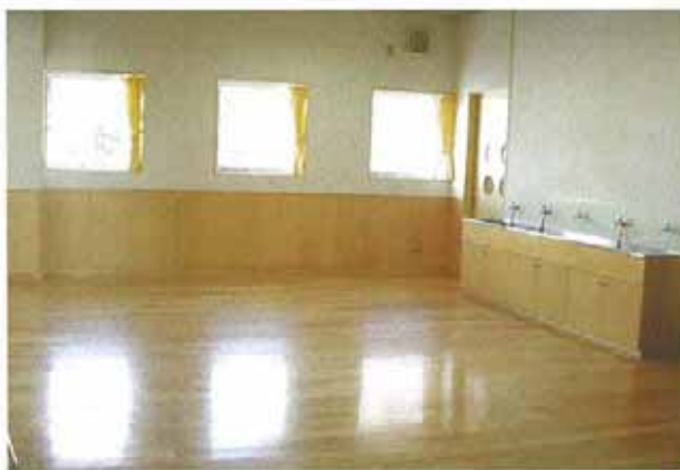
多目的ホール（ワークスペース）