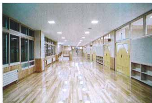
普通教室前多目的スペース