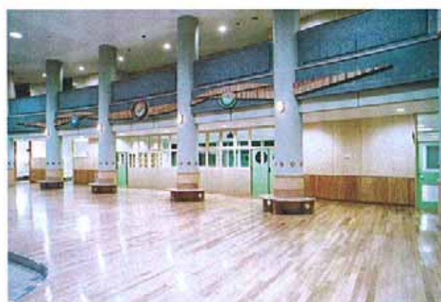
玄関ホールリーフ