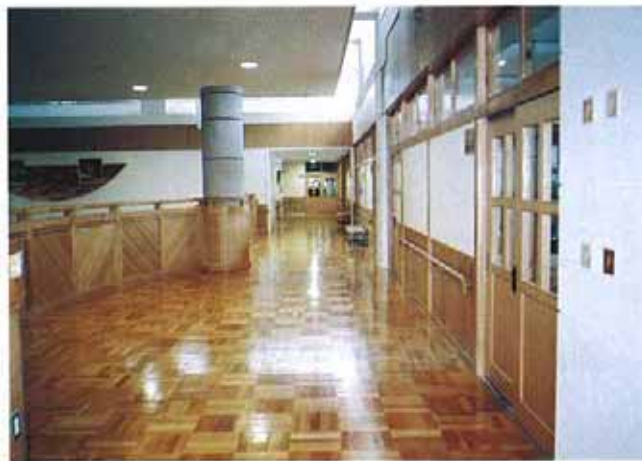
普通教室前廊下(2階)