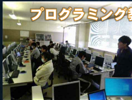
プログラミング教育