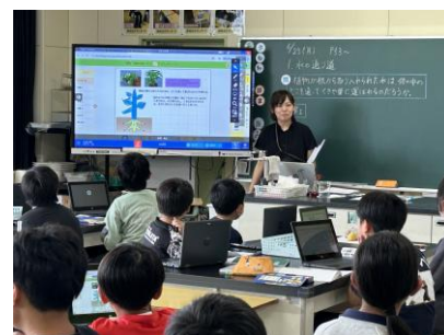
【理科専科教員の公開授業の様子】