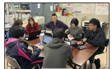
【指導体制に係る打合せ】

上記の取組により、教職員の専門性向上、児童の学習意欲の向上、そしてきめ細かな生徒指導体制の構築が着実に進展した。