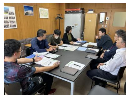
【学校力向上戦略ミーティングの様子】

学校経営方針の中で、「方向をそろえ、改善を回し、人を育てる」という学校改革の目的・方向性・具体策を明確にし、全教職員で共通理解を図った。また、「学校力向上戦略ミーティング」において、課題共有や改善方針の協議を行い、それを踏まえた適切な指示とPDCAサイクルの徹底を図ることにより、組織全体の取組の質を高めた。