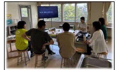
【若手教員を対象としたメンター研修】

授業の質の向上と児童理解の充実を図るため、算数科及び理科の専科指導を実施し、専門的な授業改善に取り組んだ。また、若手教員を対象としたメンター研修を実施し、授業改善や児童理解に関する助言を行い、指導力向上を支援した。さらに、児童が授業外の時間でも学びを調整し主体的に学びに向かえる場として設置した「算数ランド」を整備し、学年を越えた学び合いとICTの日常的な活用を校内に定着させた。