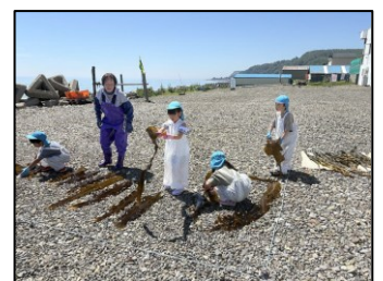
【昆布場見学・体験】