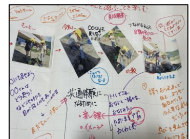
【幼児の興味に沿った保育マップ】