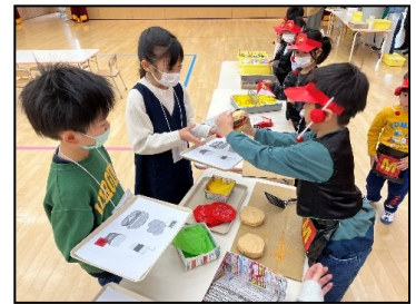
【お店屋さんごっこでの交流の様子】