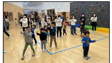
【小学校第5学年との交流の様子】