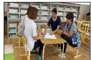
【フォトカンファレンスの様子】