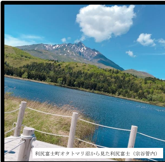
利尻富士町オタマリ沼から見た利尻富士（宗谷管内）