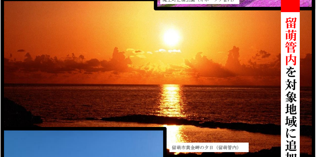
留萌市黄金岬の夕日（留萌管内）