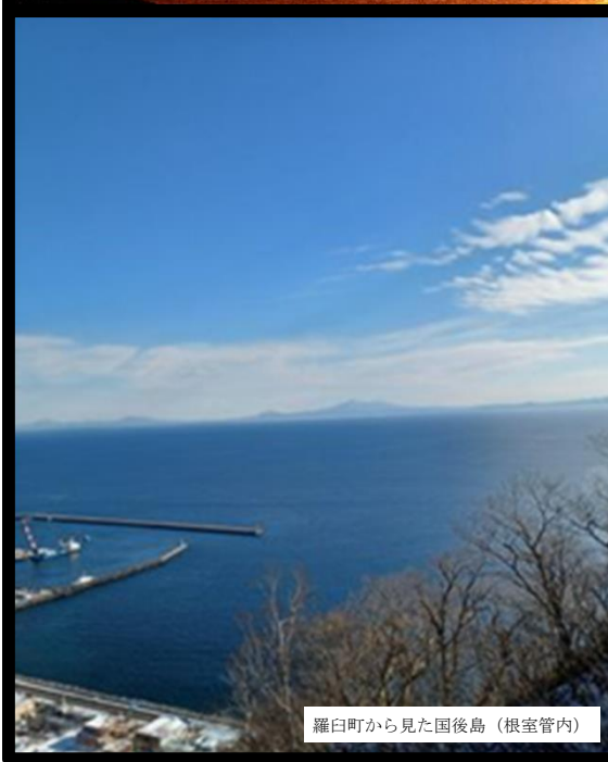
羅臼町から見た国後島（根室管内）