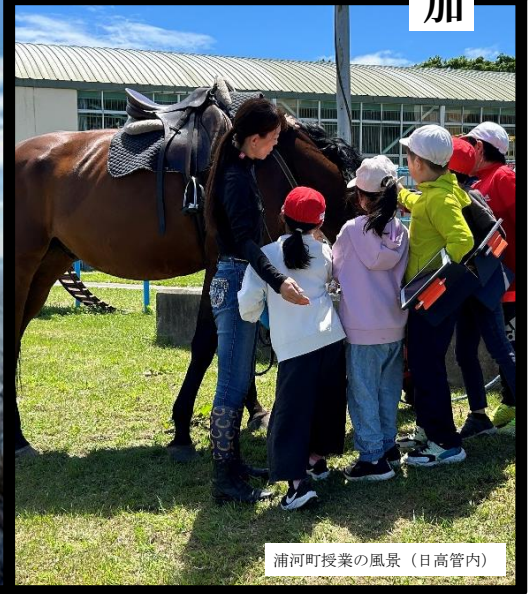
浦河町授業の風景（日高管内）