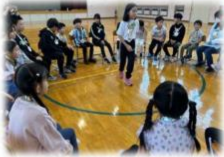
年長児・5年生との交流