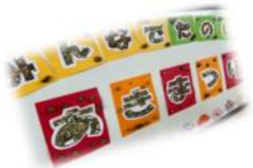
あきまつり交流会