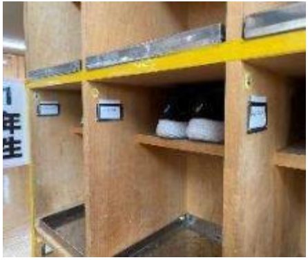
幼児教育施設で使用していたお名前シール