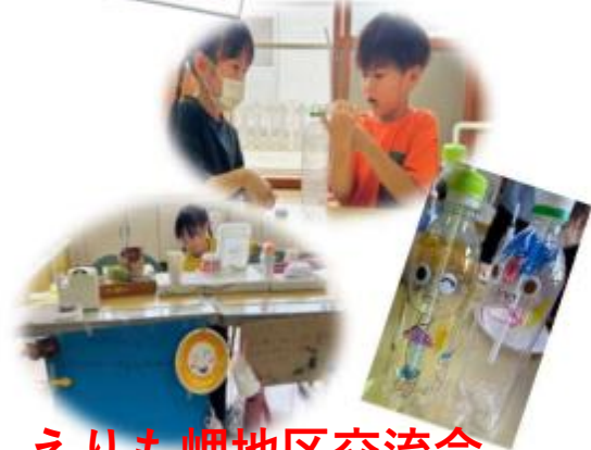
えりも岬地区交流会