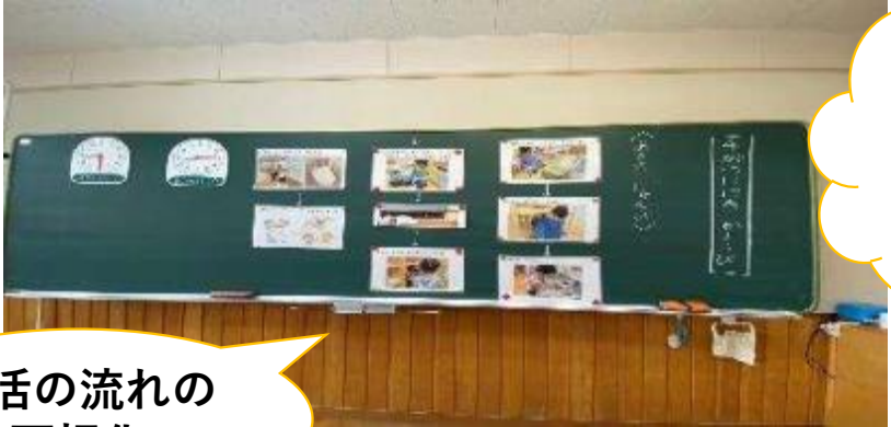
生活の流れの可視化