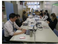
【札幌南高校生徒による進行】