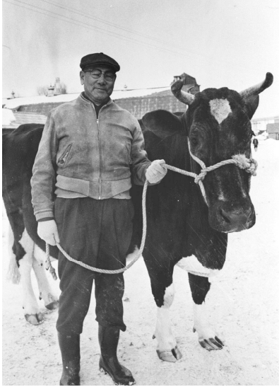
〔江別市旧町村農場所蔵〕

ここはエドウィン・ダンがつくった道内初の牧場で、敬貴の父・町村金弥は、主任として勤務していました。敬貴は七歳までこの牧場で育ちました。毎日畜舎に通い、「牛を見る