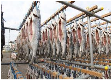
「鮭山漬け寒風干し」

北海道最東の海、根室海峡。この地では遥か一万年の昔から、絶えず人々の暮らしが続いてきました。その支えとなったのは、大地と海を往来し、あらゆる生命の糧となった鮭です。毎年秋に繰り返される鮭の遡上という自然の摂理の下、当地では人と自然、文化と文化の共生と衝突が起こり、数々の物語と共に、海路、陸路、鉄路、道路という、根室海峡に続く「道」が生まれます。一万年に及ぶ時の流れの中で、鮭に笑い、鮭に泣いた根室海峡沿岸。ここはいまも、人と自然、あらゆるものが鮭とつながる「鮭の聖地」です。