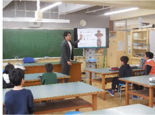
ゲストティーチャー授業の様子

授業後に行ったアンケートでは、これまで苦手だった歴史に興味を持ったこと、実際の博物館・資料館を訪れたい、縄文時代の衣食住について調べたいなど、自主的な学習の意欲を高める効果がみられました。