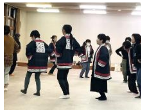
< 伝承講座風景 >