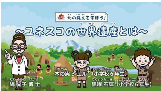
世界文化遺産に親しむオンライン教材