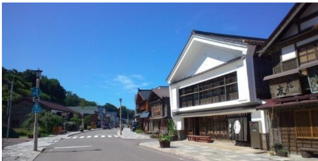
「ニシンによる繁栄が息づく江差の町並み」

ニシンによる繁栄は、江戸時代から伝承されている文化とともに、今でもこの地域に色濃く連綿と息づいている。