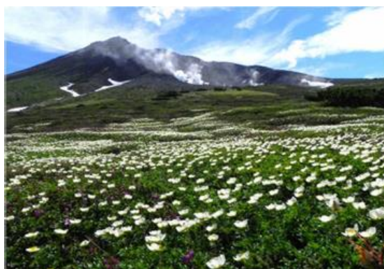
「大雪山の雄大な自然」