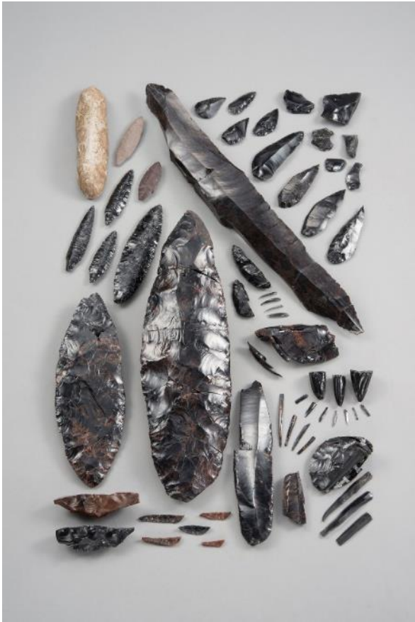
「北海道白滝遺跡群出土品」 (遠軽町)