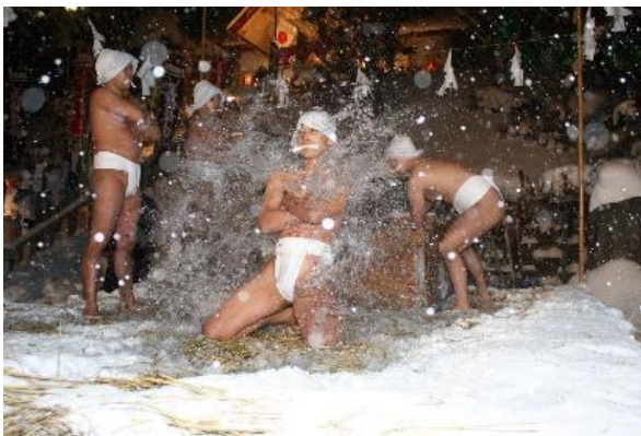
「佐女川神社寒中みそぎ神事」 (木古内町)