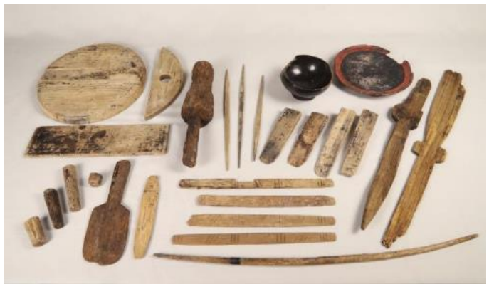
「勝山館跡宮ノ沢右岸出土品」 (上ノ国町)