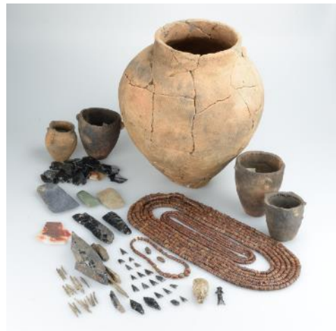
「北海道常呂川河口遺跡墓坑出土品」 (北見市)