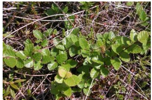
「西別湿原ヤチカンバ群落」 (別海町)