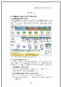
調査研究報告書・『ガイドブック』