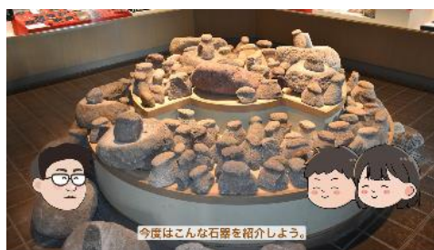
すり石（北海道式石冠）の紹介

ホームページ「学んでみよう～北海道の縄文遺跡」 URL: https://www.dokyoj.pref.hokkaido.lg.jp/hk/bnh/147722.html