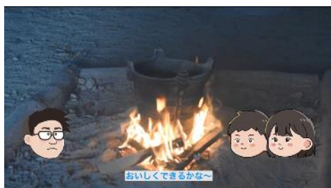
土器で食べ物を調理する様子