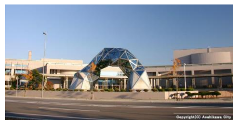
【大雪クリスタルホール】